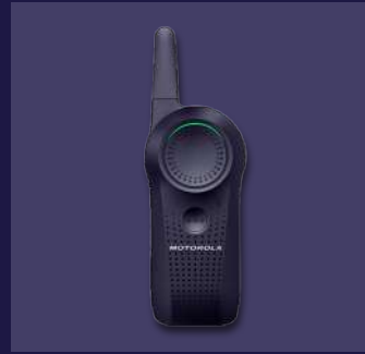
PMUF1983 Radio Curve