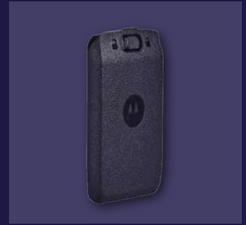
HKNN4013ASP01 Batería de capacidad estándar BT90