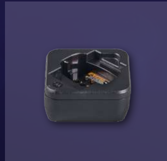
PMPN4587 CARGADOR PARA UNA UNIDAD