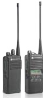
SERIE EP350 MX

También soportan accesorios de audio Mag One™, que proporcionan una opción económica para los usuarios de radio de uso ligero.